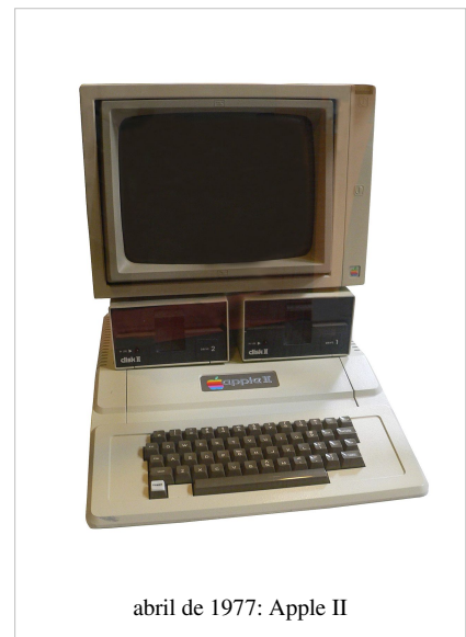
abril de 1977: Apple II

Su más alto precio y la falta de un BASIC de punto flotante, junto con una falta de sitios de distribución al por menor, lo hicieron retrasarse en ventas detrás de otras máquinas de la Trinidad